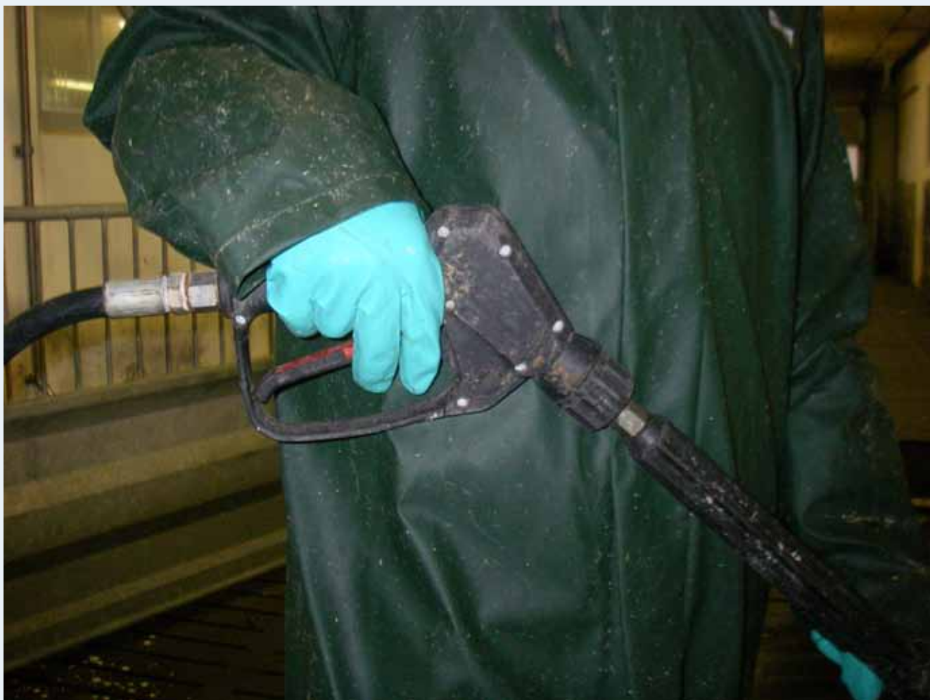
Bloker ikke højtryksrenserens holdegreb med strips, så den kan sprøjte uden at blive aktiveret.

I denne vejledning beskrives en række praktiske løsninger, der kan øge sikkerheden omkring højtryksrensning – både i form af forbedrede arbejdsmetoder og ved brug af egnede personlige værnemidler.