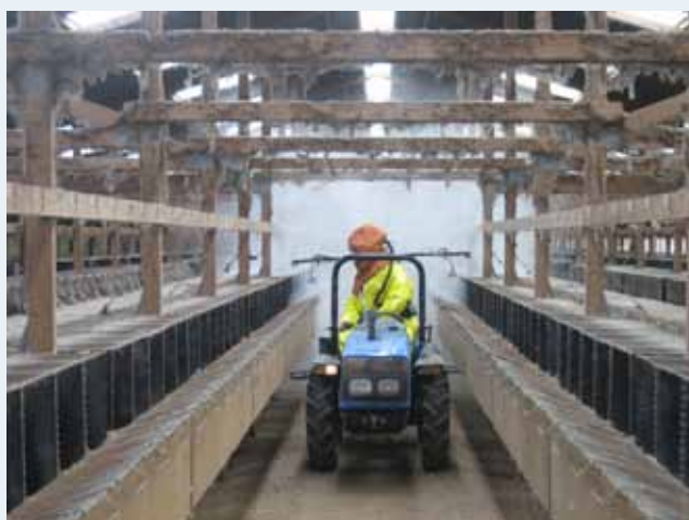
Jorden/gulvet i et minkhus kan desinficeres med hydratkalk.