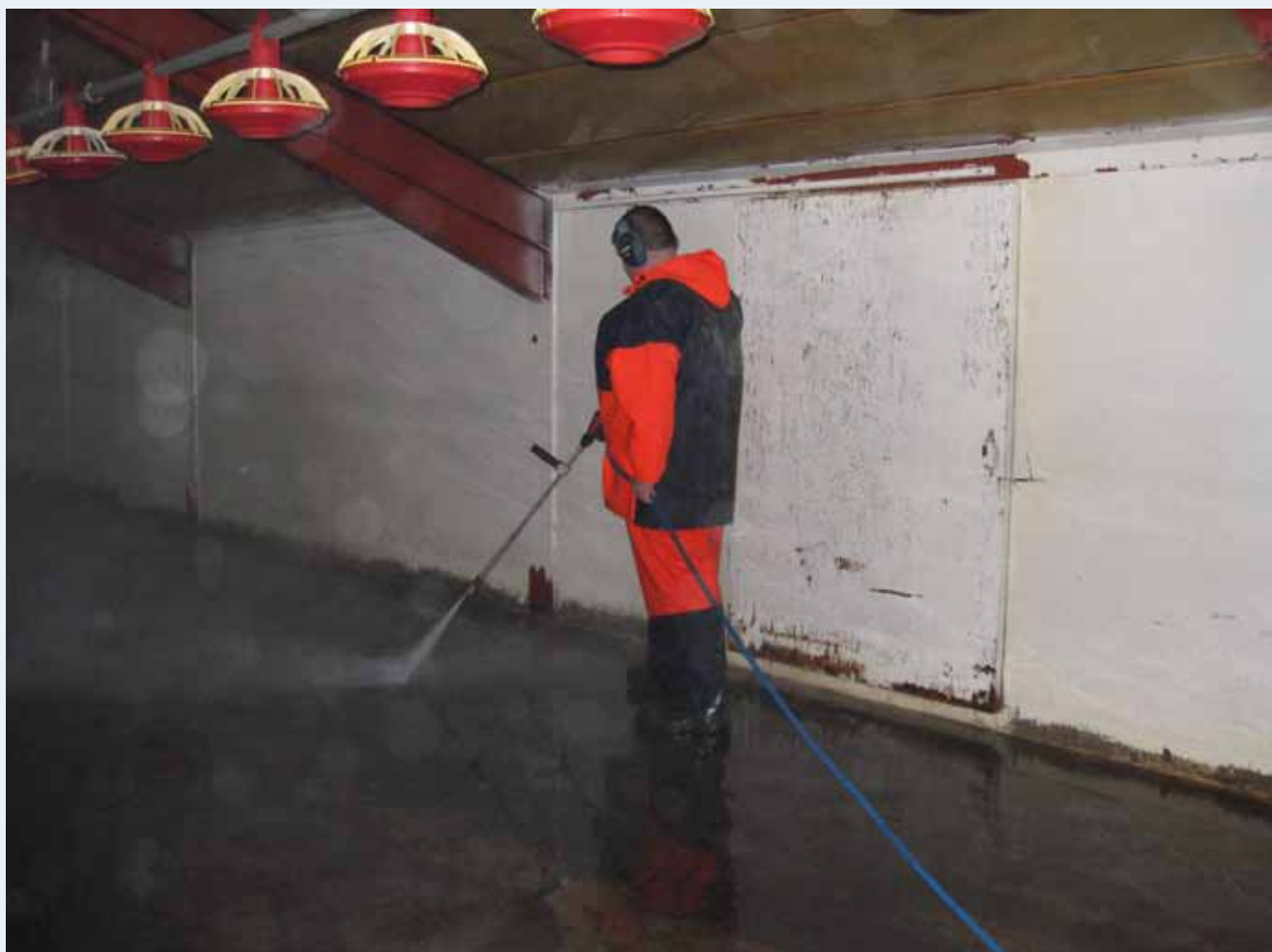
Vask af hus til slagtekyllinger.

Medarbejderen har pligt til at bruge alle nødvendige personlige værnemidler og benytte dem under hele arbejdsopgaven. Er der fejl og mangler ved udstyret, skal han/hun fortælle det til arbejdsgiveren.