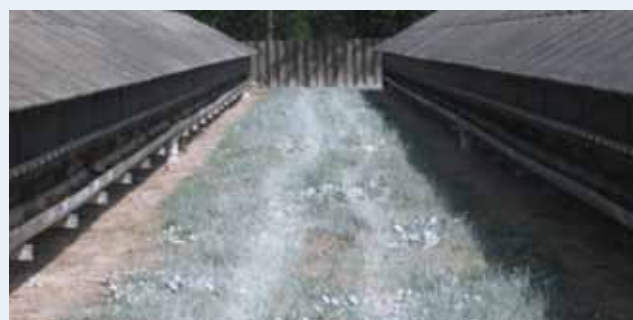
Kalkdesinficeret jord efter rengøring.

Plasmacytoseramte farme og pelserier pålægges offentligt tilsyn, herunder rengøring og desinfektion. Farmen skal desinficeres to gange med mindst en uges mellemrum. Rengøring og desinfektion skal godkendes af fødevareregionen. Der skal foreligge dokumentation for, hvilket middel der er benyttet til desinfektionen, udetemperaturen den dag, der blev desinficeret, påføringsmetode, samt navn på de personer, der udførte denne.